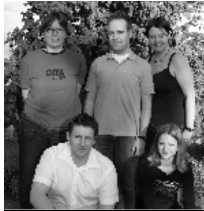
Der neue Vorstand in Apensen

Das Thema „Einheitsgemeinde Lühe“ betrifft jung und alt, daher beschäftigt sich die Junge Union Lühe/Horneburg schon seit langem damit. Am 16. Juni fand dann eine von der JU organisierte Info- und Diskussionsveranstaltung in Neuenkirchen statt. Nach interessanten Ausführungen der einzelnen Redner, entstand eine sehr hitzige Diskussion, die erst gegen 22.30 zum Ende gebracht werden konnte. Die JU Lühe/Horneburg ist sich nach diesem Abend sicher: Einheitsgemeinde Lühe ja – aber nur mit Dorfvorstehern für die sechs Gemeinden. □