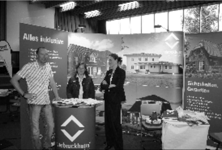
Die Firma Viebrockhaus auf der Messe

gehalten werden, die häufigsten Fragen drehen sich jedoch um „wie muss die Bewerbung aussehen“, „welche Noten muss ich haben“ und „wie läuft das Auswahlverfahren ab“.