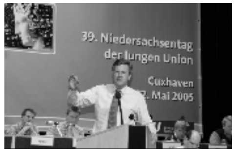
Christian Wulff bei der Jungen Union

anwesend. Auch Philipp Mißfelder, der Bundesvorsitzende der Jungen Union wollte sich den Niedersachsentag nicht entgehen lassen.