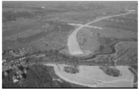
Die A 26 aus der Vogelperspektive